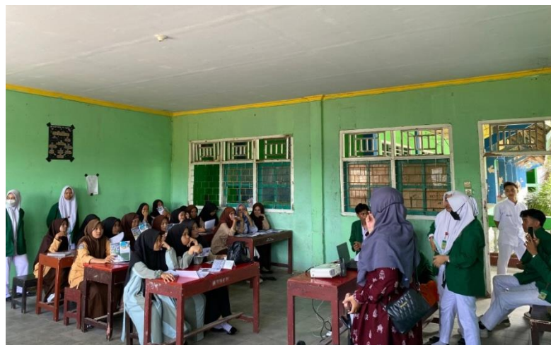
Gambar 1.1 Edukasi pemutaran video edukasi tentang bullying