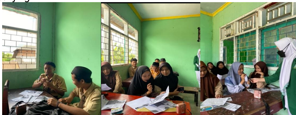
Gambar 2.1 Pelaksanaan tanya jawab tentang pengetahuan siswa tentang bullying

Terdapat beberapa siswa yang memiliki pengetahuan yang kurang tentang bullying. Pada sesi diskusi interaktif siswa aktif bertanya tentang bullying