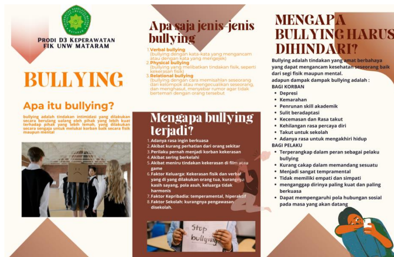
Gambar 1.1 Leaflet Bullying

Kegiatan pengabdian masyarakat diikuti oleh 24 siswa. Siswa mengikuti kegiatan dengan seksama dengan memperhatikan video edukasi bullying dan membaca leaflet yang dibagikan.